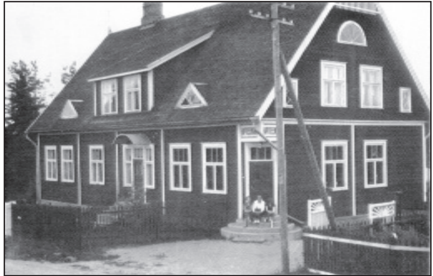
Kiviniemen apteekki 1930-luvun jälkipuolella. Sakkola oli yksi niistä harvoista luovutetun alueen maalaispitäjistä, joissa oli kaksi apteekkia, Kiviniemessä ja kirkonkylässä.

Tästä johtuen tuoreen kirjan merkitys on suuri. Kirjan loppupuolella on myös matrikkeli, johon on koottu kaik-