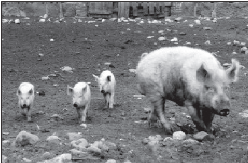
Possuperhettä Konevitsan luostarin maatilalla toukokuussa 2010.

Täällä kierteli joku vuosikymmen sitten kulkukauppias Löppönen. Hänellä oli pyöränsä päällä vähän kaupattavaa, mutta ajatukset oli sitä suuremmat. Sanoi lukeneensa, että Amerikoissa aletaan tiilitaloja rakentaa ylhäältä päin. Kyllä minä ymmärrän, jos siellä on yksi tiili, niin toisen voi siihen liittää, mutta