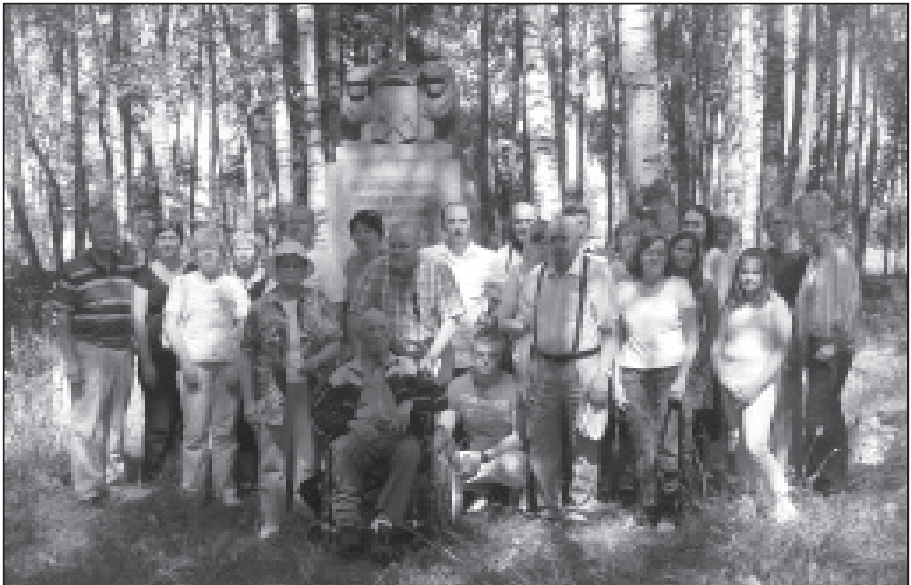
Matkalaisia muistopuiston patsaan äärellä.

PS: Tavataan Vesilahden Sakkola -juhliissa 1.8. Kiitos jo ennakkoon vesilahtelaisille tomerasti hoidetuista hommista, vaikka Narvan markkinatkin työllistävät tänä kesänä!