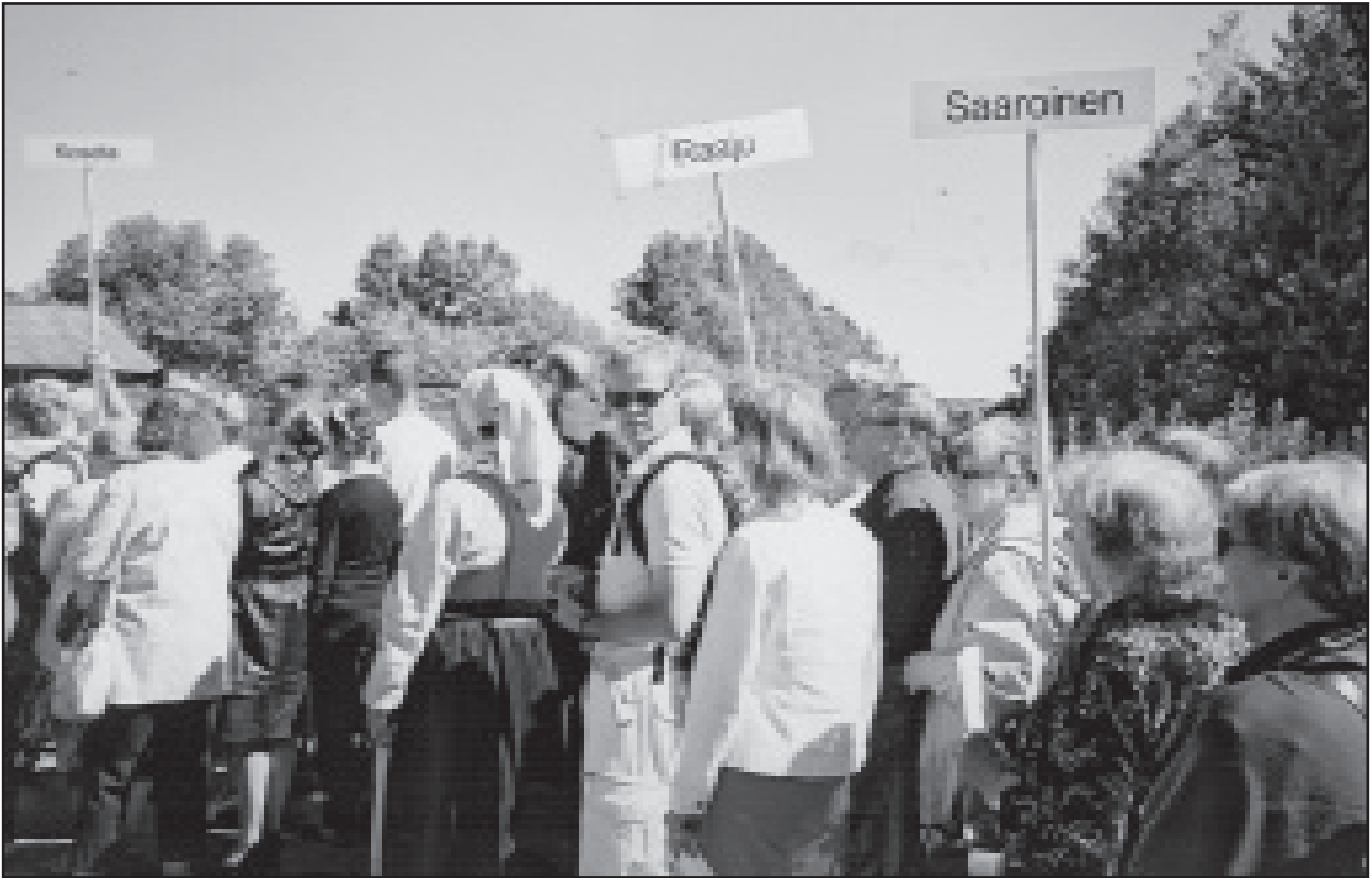
Uudelta hautausmaalta siirryttiin lahjoitusmaatalonpokien muistomerkillle kulkueena kylittäin.