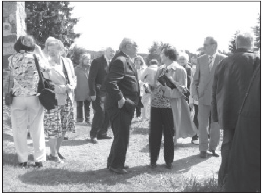
Hattulan Pyhän Ristin kirkko oli ääriään myöten täynnä juhlahjumenanpalveluksessa 6.6.2010. Kirkonmäellä tavattiin tuttuja ja vaihdettiin kuulumisia.

Toiminta on sellaista miksi yksittäiset aktiiviset jäsenet sen tekevät. Siksi erityinen kiitos toiminnassanne nyt ja menneinä vuosina ja vuosikymmeninä vastuuta kantaneille aktiiveille ja Teille seuran aktiivisille jäsenille. Karjalainen kulttuuri ja Kalevala, Elias Lönnrotin kokoamana kansallisena eepoksena ja karelianismi antoivat suomalaisuuden identiteetin ja rakennuspuita lähes parisataa vuotta sitten. Kieli ja kulttuuri ovat näin vahvana jo olleet suomalaisuuden perusta. Suomalaisuus, oma kulttuurimme sai paljon Kalevalan herättämänä paljon lisäaineksia ja valistusta monen suomalaisen merkkihenkilön kautta. He innostuivat Karjalasta. Säveltäjät, Sibelius kuuluisimpana, Madetoja ja Merikanto, kuvataiteemme ikonit Gallen-Kallela, Edelfelt ja Järnefeld, rakas runoilijamme Eino Leino. Karelianismi vahvisti kansallista itsetuntoa. Suomalaisuudesta oltiin ylpeitä ja monissa piireissä hyvin innostu-