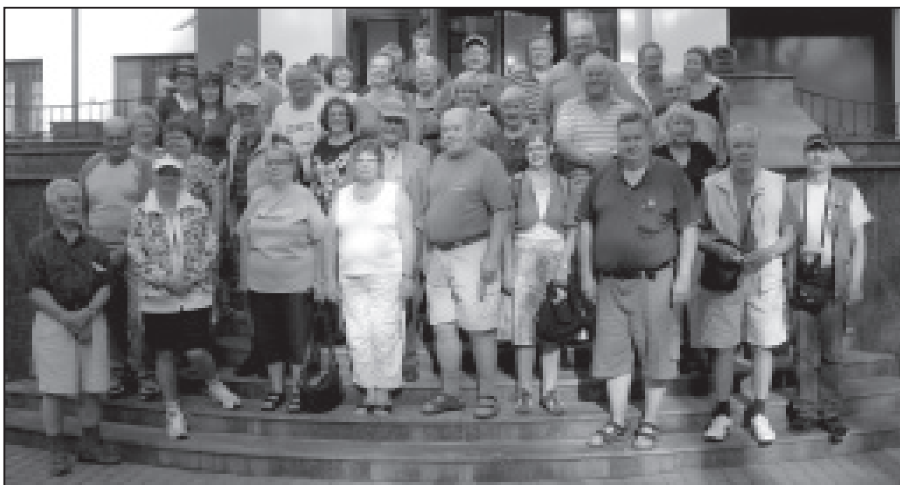
Matkalaiset Suvenhännän komean Dacha-hotellin rappusilla Suvannon rannalla.