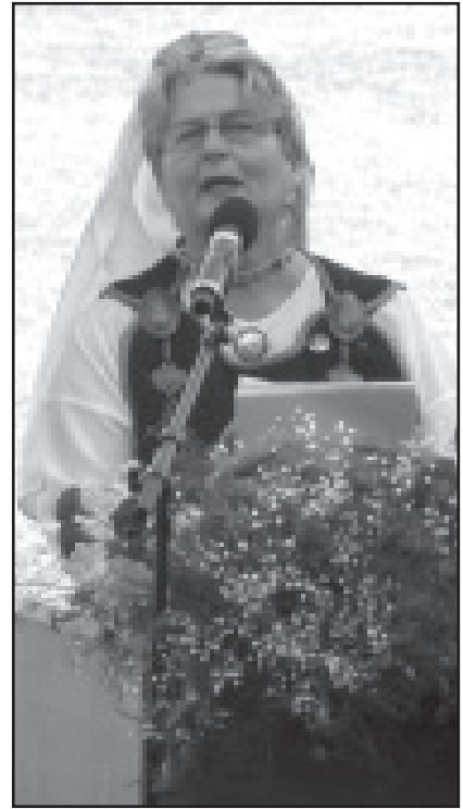
Valtioneuvos Riitta Uosukainen piti napakan, kannustavan puheen karjalaisuuteen.

– Mutta syvimpiä tunteitamme me karjalaiset emme kiellä. Niitä on loukat-